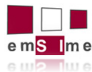
Sistema de Información de Museos de Euskadi