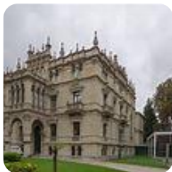
Museo de Bellas Artes de Álava